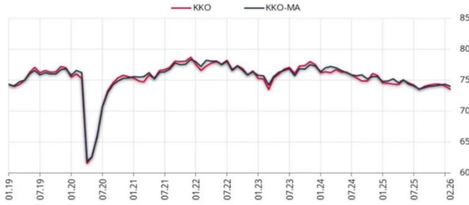
Grafik 1. KKO ve Mevsimsel Etkilerden Arındırılmış KKO (%)

2026 yılı Şubat ayında, imalat sanayinde faaliyet gösteren 1773 iş yeri tarafından İktisadi Yönelim Anketi'ne verilen yanıtlar toplulaştırılarak değerlendirilen veride, imalat sanayi genelinde mevsimsel etkilerden arındırılmış Kapasite Kullanım Oranı (KKO-MA), bir önceki aya göre 0,4 puan azalarak yüzde 74,0 seviyesinde gerçekleşti. Mevsimsel etkilerden arındırılmamış Kapasite Kullanım Oranı (KKO), bir önceki aya göre 0,6 puan azalarak yüzde 73,5 seviyesinde gerçekleşti. (Link)